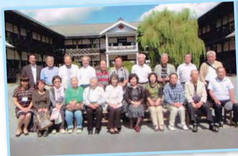
東京在住の 中田町出身者も合流