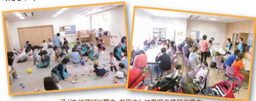
子どもは遊びに夢中。お母さんは育児の情報交換中

「中田子育てサロン」は子どもだけでなく、お母さんのためのサロンとしてますます充実させて、子育てを応援していきます。お気軽にお越しください!