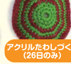
アクリルたわしづくり(26日のみ)