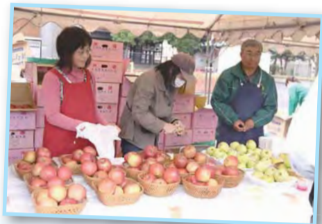
「中田町」のりんごを 中田文化祭で販売