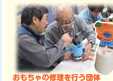
おもちゃの修理を行う団体