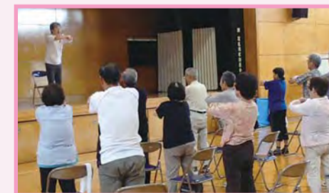
グループの育成のための講座を開催

健康長寿を目指す一環として、地域の高齢者が元気で暮らし続けるために地域で認知症予防の活動を広めてもらう「脳若返り隊」を育成しました。 ※22年度~25年度で263人を育成。