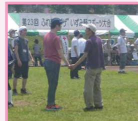
昨年は約1,500人が参加