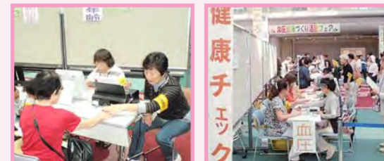
健康づくり活動フェアの様子

ウォーキングなどの健康づくり活動への取組を促進するため、自分の身体の状況に関心を持つ機会として、地域のまつりなどで保健活動推進員による健康チェックを昨年は17回・約900人に行いました。9月に行われた健康づくり活動フェアでも多くの来場者が体験していました。