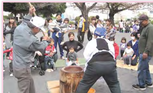
恒例になった11月の「餅つき大会」

中田・しらゆり子育てネットワークの「餅つき大会」は、しらゆり公園に100組ほどの親子が集まり、杵の音と歓声を響かせます。これらの活動を寸劇にして、子育て中のお母さんたちと一緒に、2月15日(日)テアトルフォンテで開催される「寸劇フェスティバル」で披露します。ぜひお越しください。