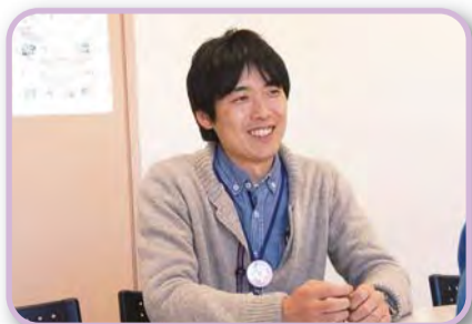
「寸劇フェスティバル」には区内の地域交流コーディネーターが参加します