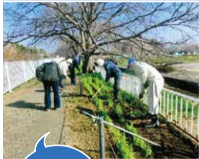
クリーン神田橋水辺愛護会の皆さん