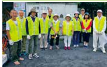
緑園三丁目ハナミズキの会の皆さん