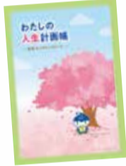
▲わたしの人生計画帳 泉区エンディングノート