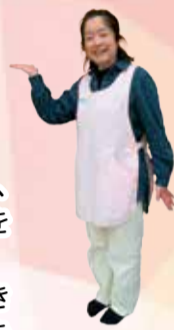
▲すきっぷ スタッフ

初めての妊娠や、転入して間もないご家庭でも、安心して利用できる ようスタッフが丁寧に寄り添い、親子の「つながり」を育む役割を 担っています。