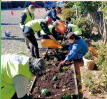
弥生台西公園愛護会の皆さん

短時間から参加でき、四季の移ろいを感じられることも魅力です。一緒に、公園で過ごす時間をより豊かにしてみませんか。