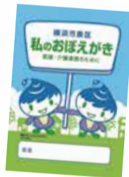
▲もしも手帳 と 私のおぼえがき