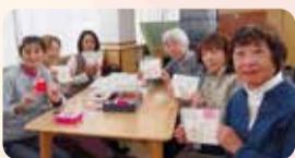
▲すきっぷ サポーターの 皆さん

こどもの健やかな成長を願って 「背守り」を真心込めて製作し、 親子にプレゼントしています!