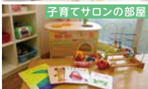
子育てサロンの部屋

実際に試食もでき て、やわらかさや、大 きさを確かめられて 良かったです 離乳食作りに生かして いきたいと思います