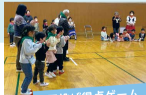
玉投げ得点ゲーム