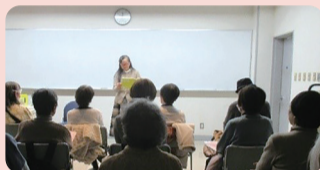
大人が楽しむおはなし会