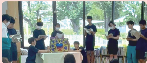
いずみ野中学校図書委員会による夏休み出張おはなし会