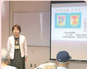
スポットライトいずみ(講演会)