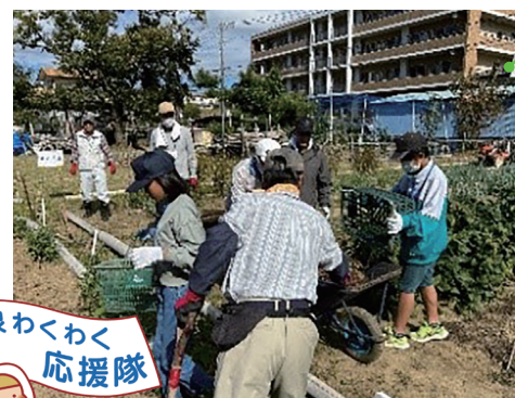
サツマイモ掘りの手伝い

小中学生が地域活動のお手伝いに、気軽に参加できるボランティア活動の仕組みを区内全域に展開します。