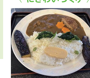
いっずんカレー(商店街スタンプラリー)