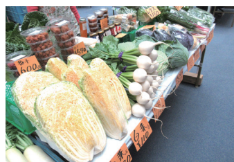
地産地消マルシェ