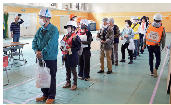
地域防災拠点での訓練

地域防災活動への参加促進を目的とし、イベントの実施や地域における自助・共助の取組への支援を通じて、地域防災の担い手の確保・育成を図ります。