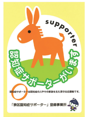
▲認知症サポーターステッカー

このステッカーを貼っているお店や事業所には、「認知症サポーター」がいます。 「認知症サポーター」は、認知症サポーター養成講座を受講し、地域で認知症の人やその家族に対して、できる範囲で手助けをする人たちのことです。泉区では、認知症サポーターやステッカー交付事業者とともに、誰もが安心して住める街づくりを進めています。