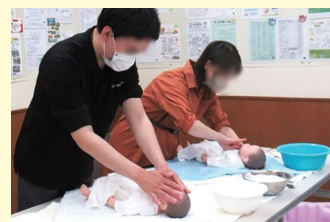
ちくよく ▲沐浴・赤ちゃん人形抱っこ体験