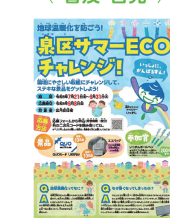
啓発キャンペーン