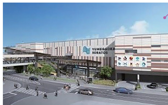
ゆめが丘ソラトス(完成予想パース図)

大規模商業施設「ゆめが丘ソラトス」の開業を契機としたイベントなどの開催や、泉区内を周遊し地域の魅力を体感できるようなスタンプラリーなどを実施します。