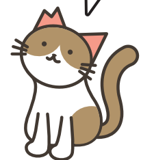
(耳カットされている猫は、手術後のしるしです)