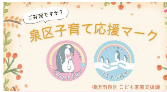
子育て応援マーク紹介動画

子育て支援施設を巡るシールラリーを開催し、地域施設の利用促進および充実を図ります。