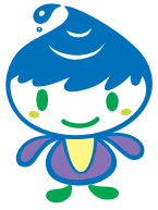
泉区マスコットキャラクター「いっずん」