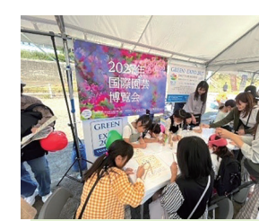
区民まつりPRブース