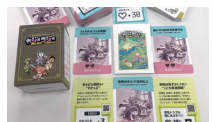
▲カードゲーム「カジークジー」

※次々と家事・育児・仕事のトラブルを話し合いながら解決していく子育てシミュレーションカードゲーム