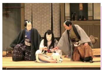
横濱いずみ歌舞伎公演