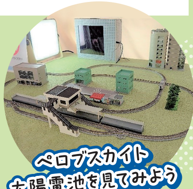
ペロブスカイト 太陽電池を見てみよう