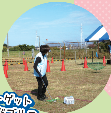
ターゲット バードゴルフ