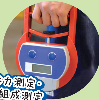
体力測定・ 体組成測定