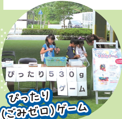
ぴったり 530g(ごみゼロ)ゲーム