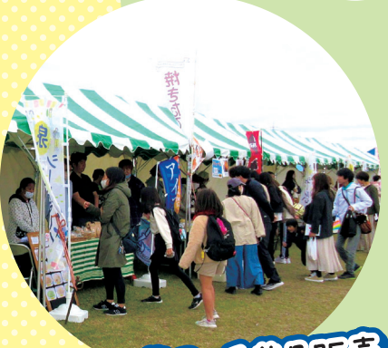
パン・焼き菓子・手芸品販売 など