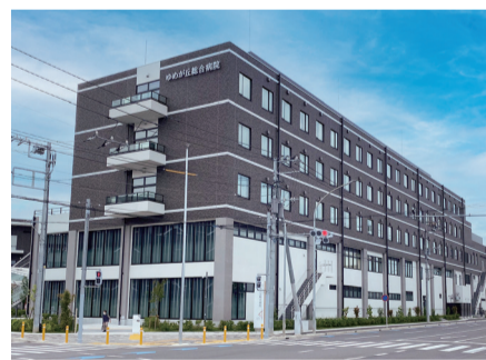
▲ゆめが丘総合病院

ゆめが丘総合病院は、4月1日に開院した27科の総合病院。日曜日を受診できる健診センターや、24時間救急センターも併設されていて、いざという時も、とても安心です。