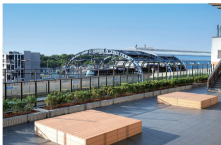
▲station view terrace

また、解放感あふれるstation view terraceでは、相鉄線の電車が走る様子や、晴れた日には富士山を眺めることもできます。