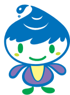
泉区マスコットキャラクター 「いっずん」