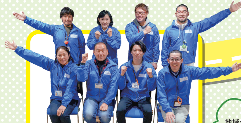
生活支援コーディネーターの皆さん