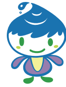
泉区マスコットキャラクター「いづん」