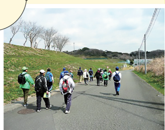
処分地施設内を見学する来場者

各種スポーツ体験やミニ電車のほか、ヨコハマ3R夢プランや地球温暖化に関するパネル展示など、子どもも大人も自然を感じながら環境問題について理解を深められる機会となっています。