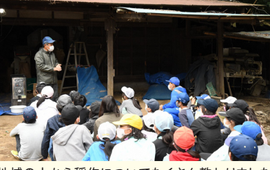
地域の人から稲作についてたくさん教わりました

その結果、感染症対策を徹底しながらミニもちつき大会を開催したり、稲わらを使った正月飾りづくりを地域の人から教わったり、煎餅や赤飯づくりにもで活動を広げたりと、例年にも勝る充実した行事となりました。