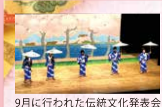
9月に行われた伝統文化発表会

和泉小学校では、6年生の総合的な学習の時間で伝統文化を学んでいます。横浜いずみ歌舞伎保存会も、伝統文化のひとつとして小学生に歌舞伎を指導しています。