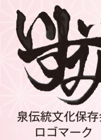
泉伝統文化保存会 ロゴマーク

泉区には、伝統文化の継承を行っている「泉伝統文化保存会」があり、三つの団体(横浜いずみ歌舞伎保存会、泉郷土芸能保存会、相模凧いずみ保存会)で構成されています。