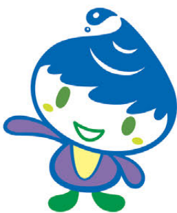
泉区マスコットキャラクター いっずん