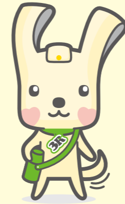
スリム「ヨコハマ3R夢」 マスク イーオ

月曜日・火曜日や祝日の翌日は、電話が大変込み合います。お時間をずらして電話していただくか、インターネットやチャット、LINEを利用してください。サービスの品質向上を図るため通話内容を録音しています。