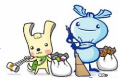
横浜市資源循環局マスコット 「イーオ・ミーオ」