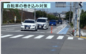
自転車の巻き込み対策 ポストコーンをゼブラ帯に設置することで、車両の左折時の自転車巻き込みを防止