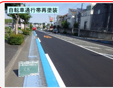
自転車通行帯再塗装