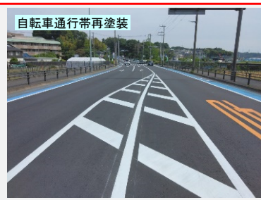
自転車通行帯再塗装