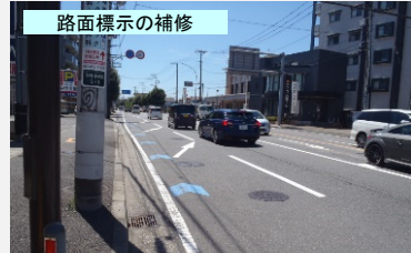
路面標示の補修 車線の明確化