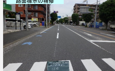
路面標示の補修 車線の明確化