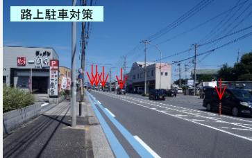
路上駐車対策 ポストコーンを中央のゼブラ帯(店舗側)に沿って5本設置することで、路上駐車を抑止