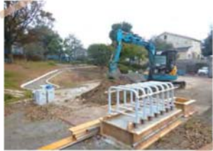
園路を再整備し、車止めを制作中の岡津公園。引き続きベンチや砂場の更新等の工事を実施します。

今年度は、岡津公園および領家三丁目公園で舗装や樹木の更新を含む工事を行っており、和泉町桜川公園ほか5公園でも遊具、トイレ等を更新する予定です。