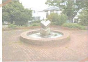
領家三丁目公園では主に劣化した舗装の更新を行います。また老朽化した噴水を撤去し、丸い形を生かした花壇にします。

工事内容や公園が利用できない期間については、各公園に掲示しますのでご覧ください。工事期間中はご不便をおかけしますが、安全で安心な公園にするため、ご理解ご協力をお願いします。