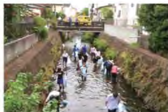
村岡川(宇田川)の山百合水辺愛護会と地域の中学生による清掃活動