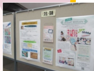
過去の開催の様子です。