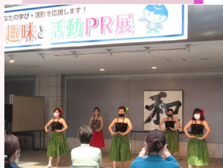
過去の開催の様子です。