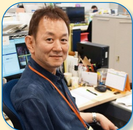
テレビ朝日広報局