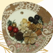
アロマストーンサシェ