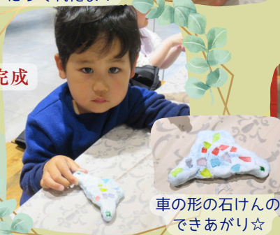
車の形の石けんの できあがり☆