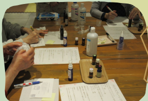
アロマスプレー作り