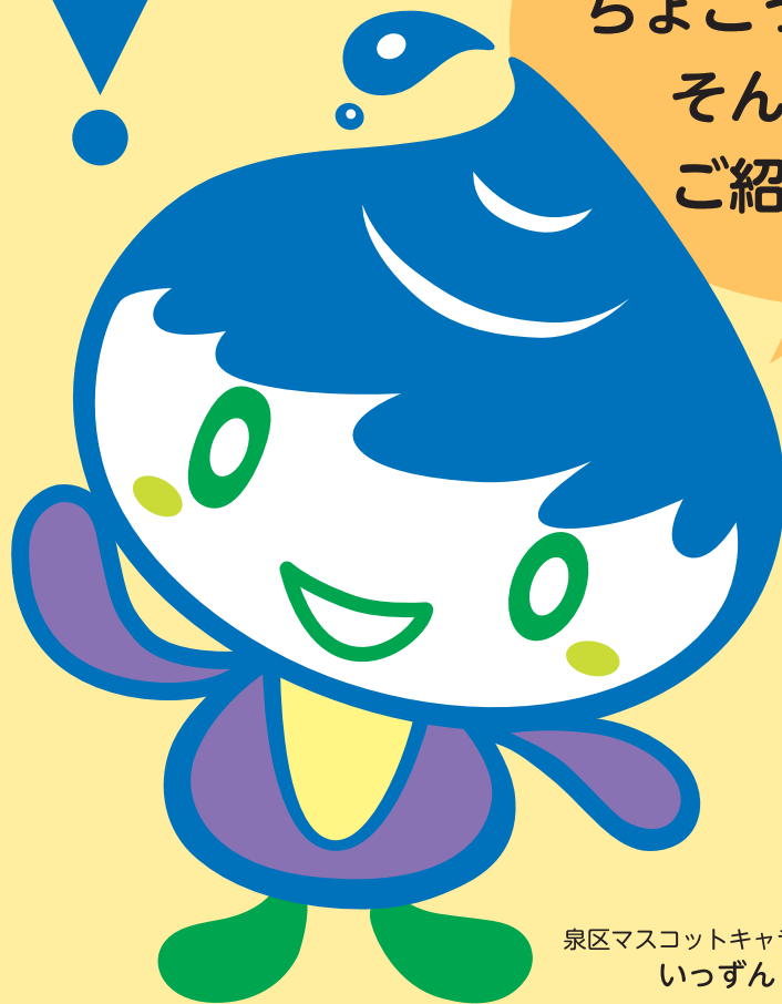
泉区マスコットキャラクター いっずん