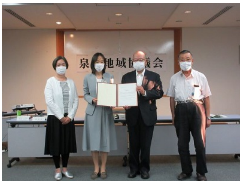
課題検討依頼の様子

6月10日の第1回定例会では、「次世代と築く地域づくり」についての検討を区長から依頼されました。