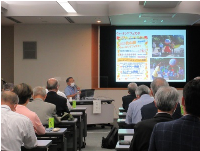
北山田町内会の事例紹介の様子