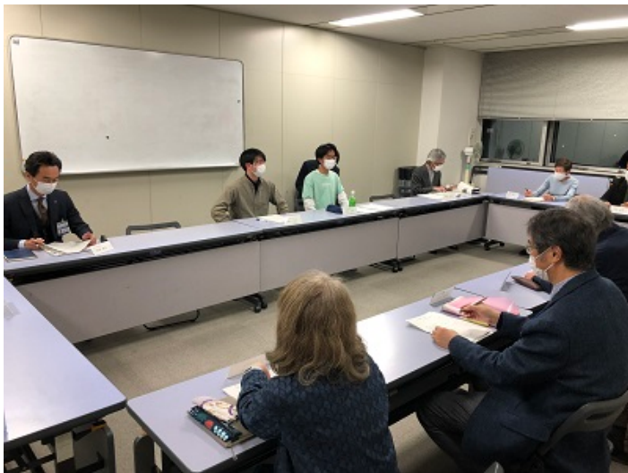
Bグループ 『コミュニティカフェ・居場所について』