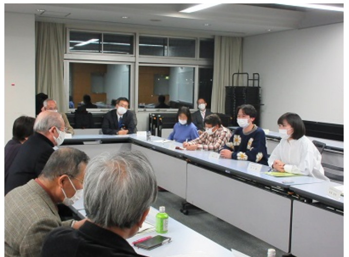
Cグループ 『団地のイベントについて』