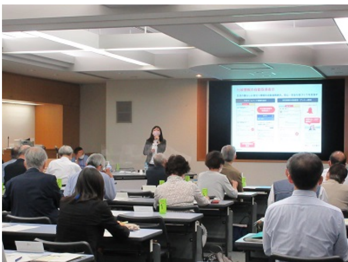
地域SNS「ピアッザ」活用事例紹介の様子

(参考) PIAZZA株式会社と相鉄沿線4区(旭、保土ヶ谷、瀬谷、泉区)は令和3年2月に連携協定を結び、行政情報の発信や住民同士のコミュニティ形成を進めています。