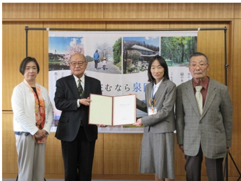
意見書提出の様子

泉区のホームページに掲載されていない資料につきましては、地域力推進担当までお問い合わせください。