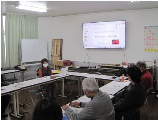
西区第4地区社会福祉協議会での講義の様子

地域の福祉向上を目指して取り組んでいる企画や地域の担い手を増やすための活動、オンラインを活用してつながり続けるために工夫した取組についてお話をうかがいました。