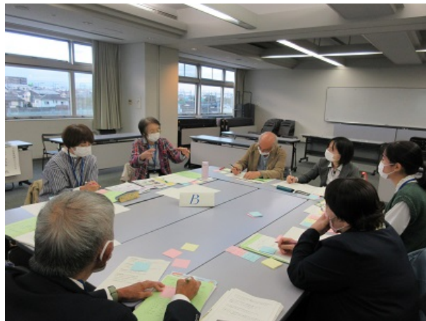
地域で取り組みたいことを共有し合う様子