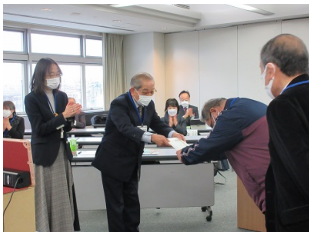
修了証授与の様子