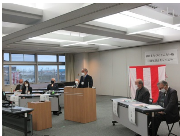
10周年記念セレモニーの様子

また、泉区役所からは、区内で長く地域活動に携わってこられた主な方々の取組や経験談などをまとめた冊子『活動の継承』を紹介しました。