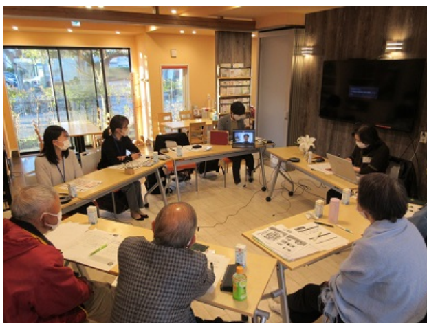
穏やかな雰囲気スペースでの講義の様子

公園に面した立地を生かした多世代交流型スペース。子どもから高齢者まで幅広い世代が自由に安心して利用できる秘訣や子ども食堂などの食支援、介護予防事業などに関わる取組などについてお話しいただきました。