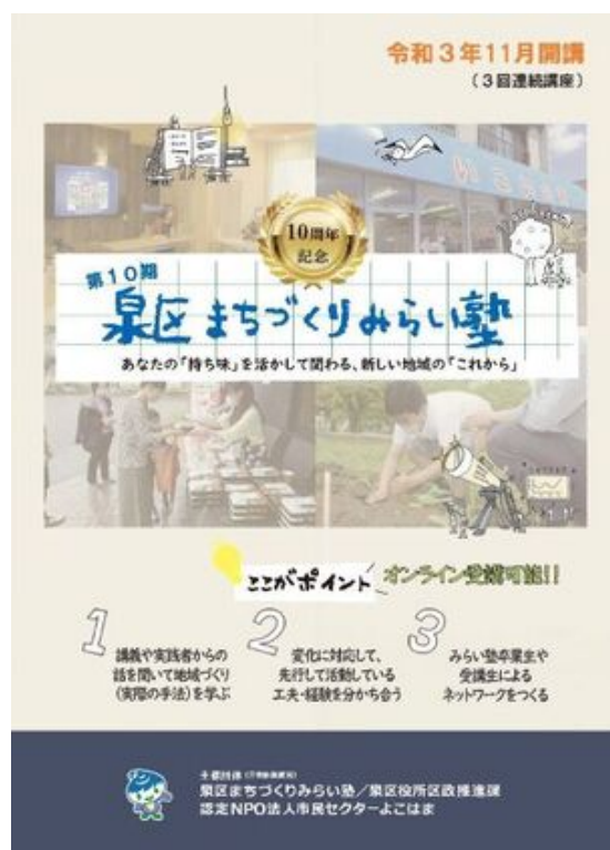
令和3年度泉区まちづくりみらい塾チラシ

現状のコロナ禍において多くの地域活動が停滞しているなか、独自の工夫や新たな取組に挑戦している団体があります。またその一方で、地域の活動に対して興味や関心を持つ人が増えています。