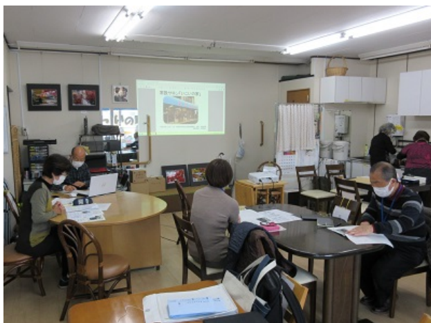
壁面を利用したいこいの家での講義の様子

誰でも気軽に立ち寄れる場所を提供しているいこいの家。コロナウィルス感染予防ガイドラインを作成し、ちょっとした支援が必要な人のサポートや見守り活動などを継続するために工夫した内容についてうかがいました。