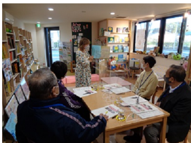
コンサートリーディング実演の様子