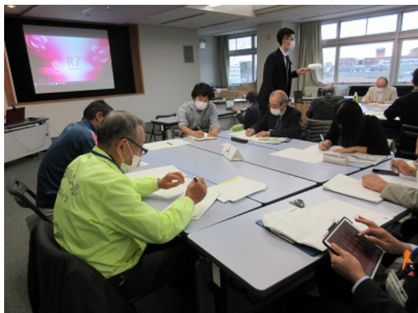
ワーク「地域で自身が取り組みたいこと」

3つの事例紹介や講義を聞いて、それぞれが感じたことや取り組んでみたいことを発表し合いました。受講生それぞれが目指す地域のための取組に対して、情報やアドバイスなど様々な意見交換をグループごとに行いました。