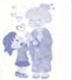
さくらまつりの様子

高齢者サロン(11か所).....3255名 十日会.....385名 健康体操教室(13教室).....5237名 子育てサロン(1か所).....230組 子育てサークル.....4グループ 赤ちゃん教室(3か所).....768組 そよ風フェスタ.....1000名