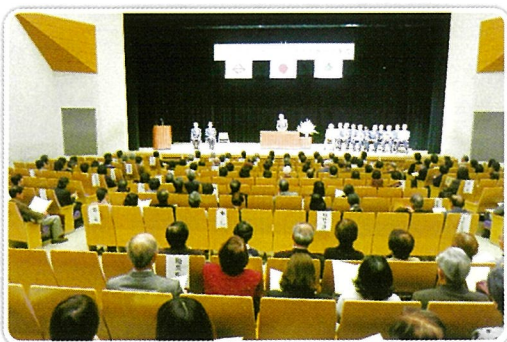
委嘱状伝達式（平成28年12月1日 泉公会堂）

平成28年12月1日付けで新しい民生委員・児童委員が決まり、厚生労働大臣・横浜市長から委嘱状が交付されました。