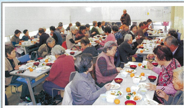
高齢者のお食事会の様子

12地区すべてで、高齢者のお食事会を実施しています。開催回数や会費などは地区により異なります。高齢者の方が集まり、食事しながら楽しく交流できる会を民児協が主催・共催したり、他の団体と協力したりして、活動しています。