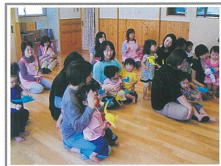
子育てサロン(人形劇)の様子

また、毎年春に開催される「軽スポーツ大会」では、障害のある方と学生ボランティアのふれあいの橋渡しをしたり、毎年秋の「親と子のコンサート」では、赤ちゃんなどを連れて親子と一緒に音楽に親しめるよう協力したりしています！