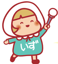
泉わくわくプラン推進キャラクター いずちゃん