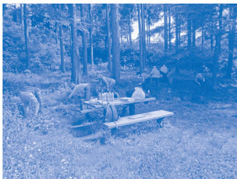
新橋市民の森休憩広場の草刈り・清掃

このクラブは新橋の自然を観察しながら、地域で活動できる仲間作りを目的として平成20年10月にスタートしました。途中から自然観察、郷土史、仲間づくりを3本柱として実施しています。また、小学生を対象に「阿久和川の水質と生きもの調査」、新橋町に長く住んでこられた方から昔の新橋を語っていただく「新橋の昔を語ろう知ろう!!」、森を守る会と新橋小5年生の四季の観察会（現新橋市民の森）へのお手伝い等を実施してきました。さらに、「新橋市民の森」平成27年1月開園に向けて原弥生自治会、森を守る会と協働し、開園後は愛護会に参画し、5月、9月、2月に草刈りや清掃もしています。