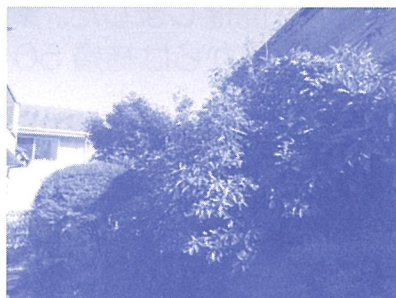
枝がうっそうと生い茂ってます