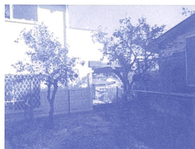
すっきり明るくなりました

29年6月末に廃業する雀荘から自動卓4台をもらい受け、特別養護老人ホーム、横浜市新橋ホームの会議室を利用することができ、7月から月曜と木曜日の午前と午後3時間ずつ実施開始しました。手動卓1台を初心者向けとし、自動卓4台を新橋ホームや近隣のゲームができる人達で楽しんでいます。