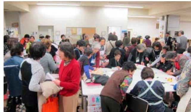
ボランティアフォーラム