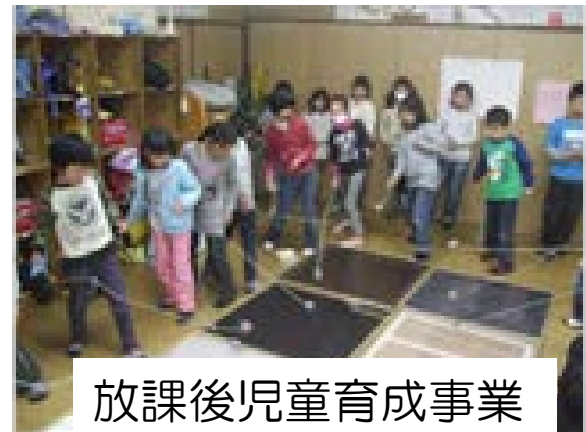
放課後児童育成事業