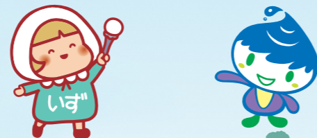
泉わくわくプラン推進キャラクター 泉区マスコットキャラクター いずちゃん いっずん