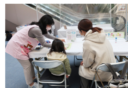
・ワークショップの様子