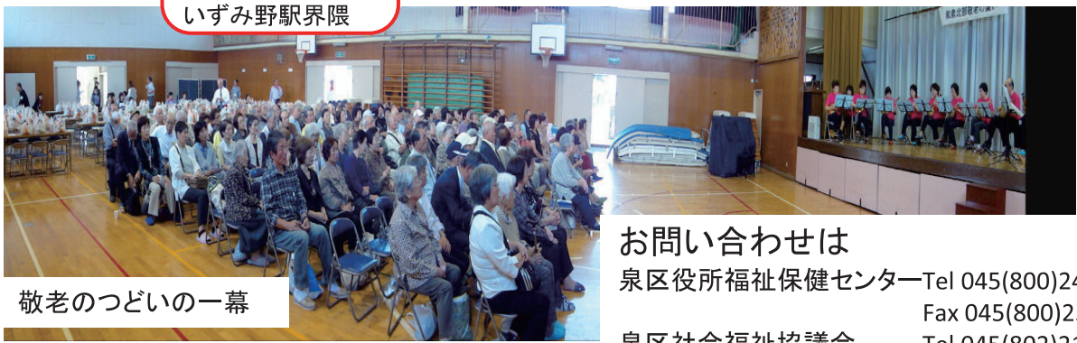
敬老のつどい的一幕