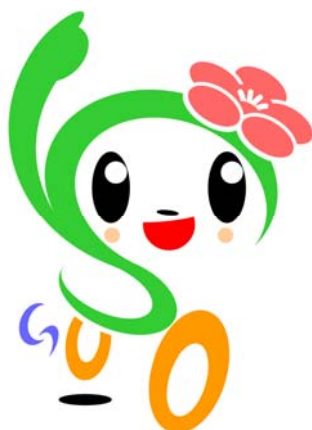
磯子区マスコットキャラクター いそっぴ