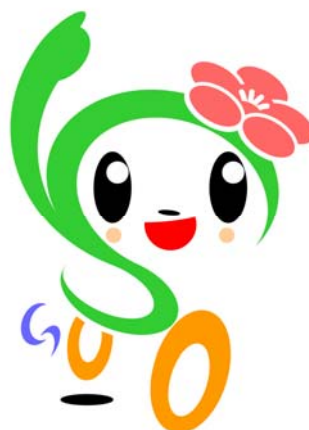
磯子区キャラクター「いそっぴ」