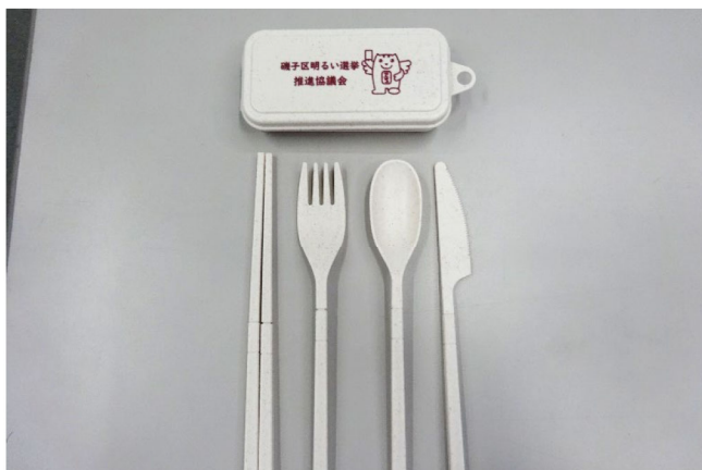
▲啓発物品（カトラリーセット）