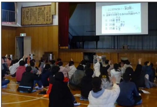
▲出前授業で選挙クイズを実施

公民の授業がまだ行われていなかったため、「選挙」のことを知らないという児童が多い様子でした。給食選挙の結果は接戦となり、大変盛り上がりました。18歳になって投票できるようになったら、今回学んだ内容を少しでも思い出してもらえれば嬉しいです。