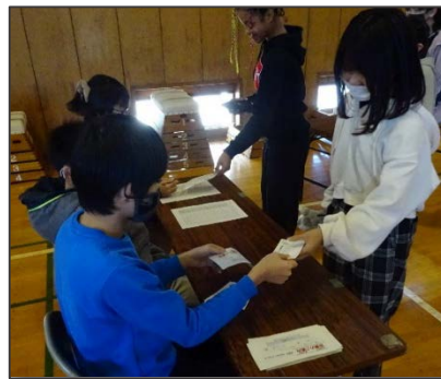
▲名簿確認後、投票用紙を交付