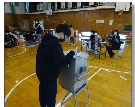
▲本物の投票箱に投票！