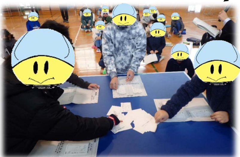
洋光台第三小学校の様子（上..演説、下..開票）