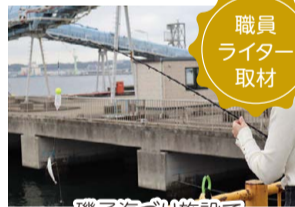
磯子海づり施設で初心者が釣り体験!

「ISOGO+」では、区制100周年に向けて、写真で振り返る100年の歩みなども発信していきます。