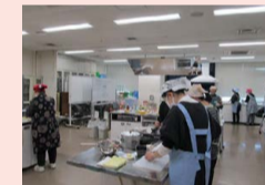
調理実習(セミナー)の様子