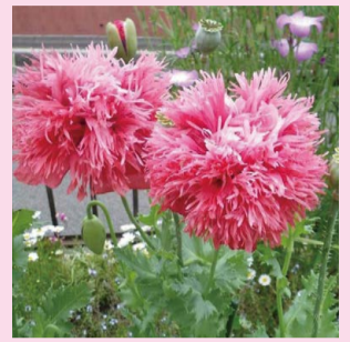
ケシ(ソムニフェルム種) 厚生労働省「大麻・けしの見分け方」より

「けし」の仲間は4～6月にかけて色鮮やかで美しい大きな花を咲かせます。空き地や公園には野鳥や風により種子が運ばれた草花が自生しますが、時に「植えてはいけないけし」が混ざっていることがあります。