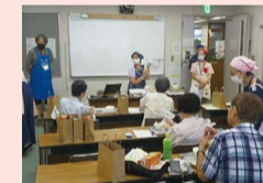
ヘルスマイトの活動の様子

ヘルスマイトになると、健康や食育の知識がぐっと広がります!仲間と協力して活動できる温かい雰囲気や、食育を通じて地域の方や子どもたちの笑顔に出会えることが、何よりの魅力です。料理が得意でなくても大丈夫!一緒に活動しませんか?