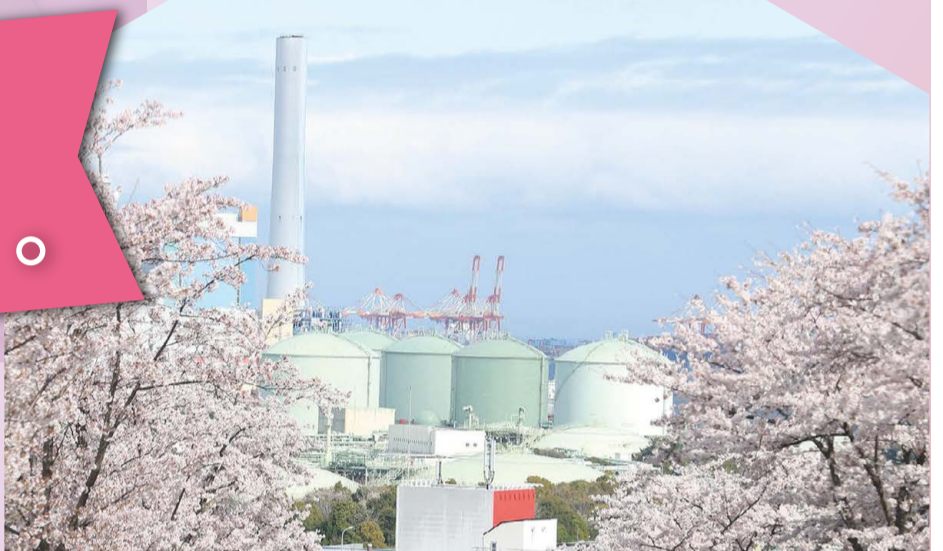
磯子台から見る桜