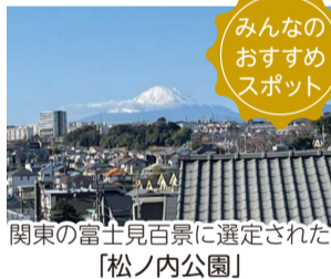
関東の富士見百景に選定された「松ノ内公園」

「磯子の逸品」や区内の見どころの他、一般募集で集まった「みんなのおすすめスポット」をマップで紹介!さらに、区役所職員ライターがまちを取材した特集記事など、ここだけの旬な情報をお届けしています。