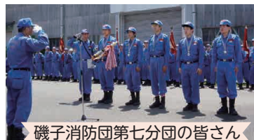
磯子消防団第七分団の皆さん