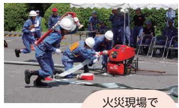
火災現場で 必要な技術を 高めています！

消防操法技術訓練は、火災現場を想定した消火活動を、安全かつ迅速、正確に行うものです。今年度の訓練会では、洋光台一丁目から六丁目を管轄する第七分団が最も優秀な成績を収めています。磯子まつりでも放水訓練を披露する予定ですので、ぜひご覧ください！