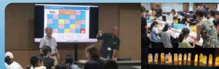
令和7年8月19日(火)子ども消費生活セミナーの様子

随時 地域のみなさまの消費者力を高めるため、様々なテーマで啓発講座を実施しました。