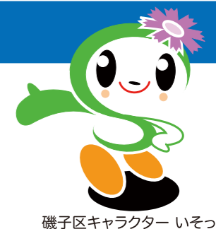
磯子区キャラクター いそご