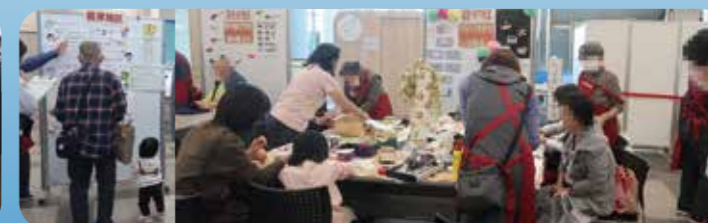
令和7年11月3日(祝・月)得トク生活フェスタの様子