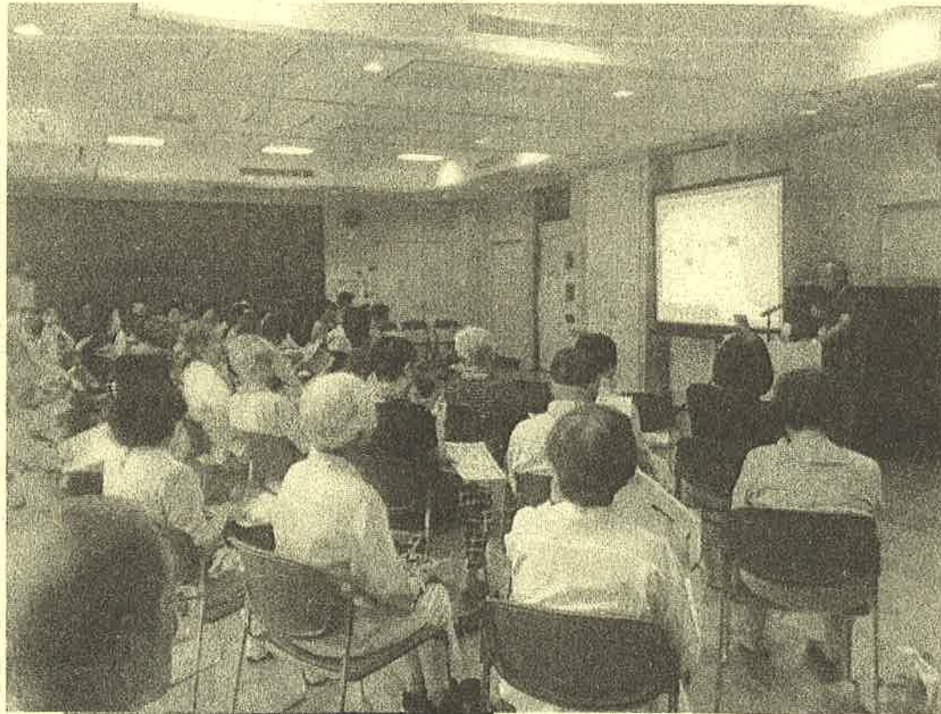
洋光台地域ケアプラザで行ったミニ講演。お年寄りを中心に50名の参加があり、盛況でした。

悪質商法被害未然防止に向け、洋光台地区では2回のミニ講演を行いました。 7月27日は洋光台地域ケアプラザにて、やさだ整形外科クリニック院長によるロコモ予防講演会の前段に時間をいただき「私は騙されない」と題し、架空請求の手口と対策、なりすまし・語り電話や無料商法に関する話をしました。 12月1日はCCラボで行われた「認知症予防カフェえんがわ」の中で15分ほど講演しました。ここではある自治会で実際に起こった訪問販売による被害と二次被害の話があり、怪しい人(または知らない人)はむやみに玄関に入れない。高齢者の一人暮らしや高齢者が一人である時間が長い家では、普段から留守番電話の設定にしておき、知らない電話や不審な電話は出ないようにすると安心だと呼びかけました。 この2回の被害未然防止の啓発活動は、いずれも洋光台地域ケアプラザからの講演要請にこたえたもので、お年寄りを中心に7月は50名超、12月はスタッフを含め30名の参加がありました。