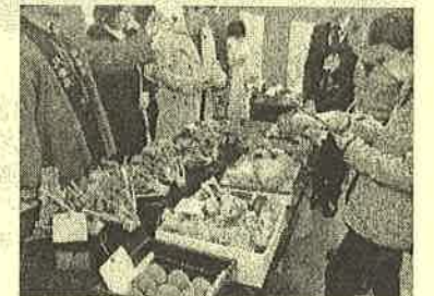
どれも見事な出来映えに審査の目も真剣!

11月18日(土)JA横浜磯子支店(磯子区田中)で農業まつり農産物持寄り品評会が開かれ、洋光台地区より3名(ほかに上中里地区より3名)が審査員として参加しました。 区内の農家が自慢の農産物を持ち寄り、その品質と栽培技術を競うもので、人と自然に豊かな暮らしの実現、地域とのふれあい、食の安全安心を守る——という理念のもと毎年催されている行事です。 出品作も大根や白菜、かぶ、ネギ、みかん、レモン、里芋、八つ頭、ジャムや梅酒と多彩。 この日審査結果が発表され、1月10日の褒章授与式で入賞者への表彰が行われました。