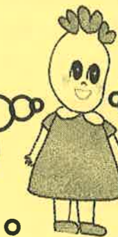
イメージキャラクター ささげちゃん