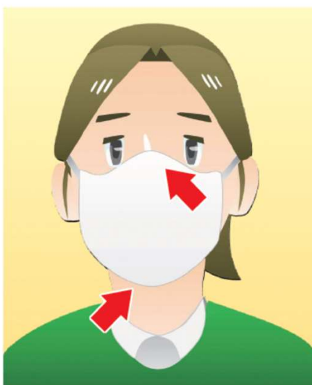
①マスクを着用する (口・鼻を覆う)