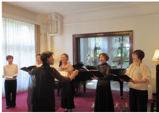
奏と響きの楽しさを求めた5人のプチプチグループ