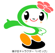
磯子区キャラクター「いそっぴ」

ご要望に応じて提案させていただきます。 着付けから所作、踊りなど一から丁寧に教えます。