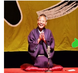
いそご区キャラクター「いそっぴ」