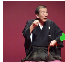
いそご区キャラクター「いそっぴ」

古典から新作まで人情噺からコッケイ噺までご希望に応じます。 時間もいかようにも合わせます。プログラムの希望は、申しつけ下さい。