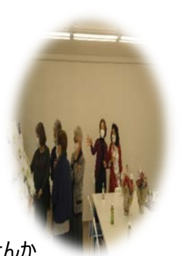
一緒に弾いてみませんか