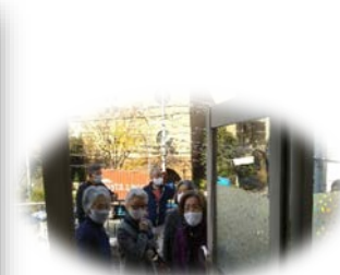
←手作りの看板がお出迎え