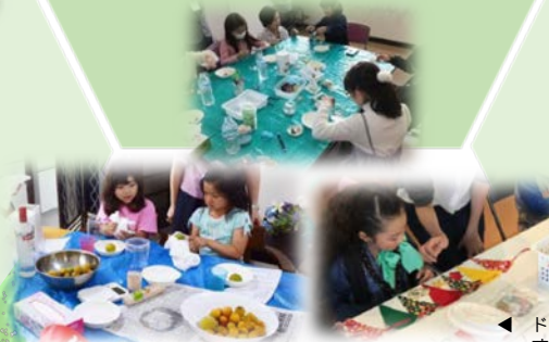
◀ ドアや窓・壁を装飾するガーランド

「梅の実がなりすぎてとりきれない…」という地域の方のお庭にお邪魔し、梅を収穫。その梅でシロップづくりを行いました。