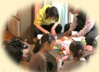
▲折り紙教室の様子

取材に伺った日は、折り紙教室に加えて、またまたご親戚主催の「ちぎり絵教室」が開催されるなど、カフェをきっかけに新たな活動が広がっています。