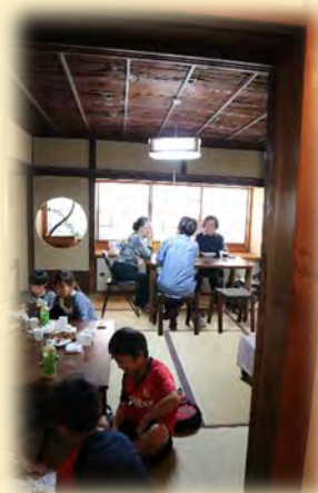
▲廊下から見たカフェの様子