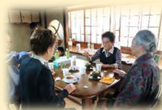
▲カフェの常連の皆さん