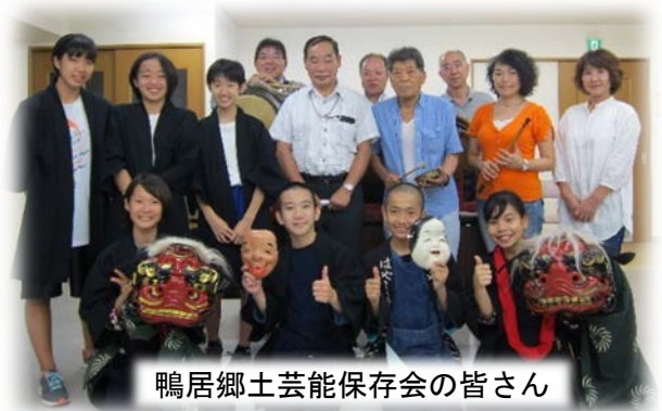
鴨居郷土芸能保存会の皆さん

学校の行事や敬老会など人前で発表する機会も増え、年明け、1 月 7 日には、町内で獅子舞演奏の予定です。