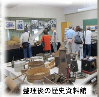
整理後の歴史資料館