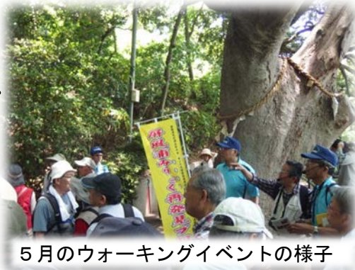
5月のウォーキングイベントの様子