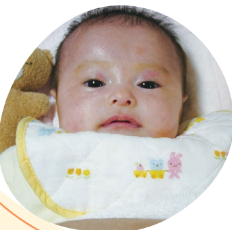
生後まもなくの頃

光さんは、生後まもなく発作が起こり、しばらくして原因がてんかんであるとわかり安心したものの、治るのかもわからず、不安に押しつぶされる日々でした。