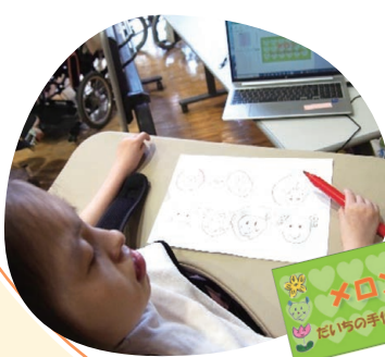
光さんオリジナルの クッキーラベル (通所先にて)

病弱で熱を出しやすいので、絶えず発作の心配をしながら、身の周りのこと全てに介助が必要です。そのような状況の中でも地域療育センターや特別支援学校の保護者や子どもたちと出会い、保護者同士で話すことによって、お母さんは気持ちが楽になっていったといいます。 「〇〇ができるように」ではなく「元気であればいい」と思うようになりました。