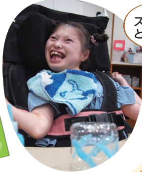
風鈴づくり (通所先にて)