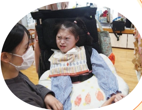
「どうやってやるの?」と 真剣な表情

「姿勢を変えてほしい」「活動に飽きちゃった」と伝えたくて、酸素飽和度が下がることもあります。嫌な時は、身体はつっぱり、目を静かに閉じることも。 重度の知的障害と身体障害があり、発語はないけれど、伝えたい想いは支援者たちが素早くキャッチしています。