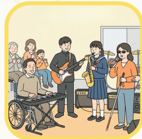
強みを活かして 地域を盛りあげよう