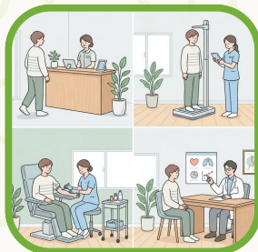
検診を受けて 自分を大切にしよう