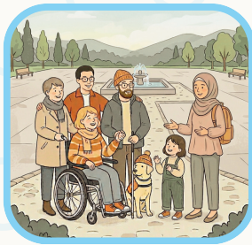
みんなの違いや個性を 大切にしよう