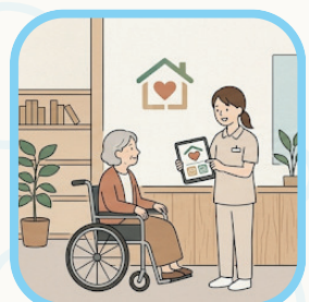
使える福祉サービスを 味方にしよう