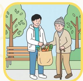
誰かの「困った!」を 助けよう