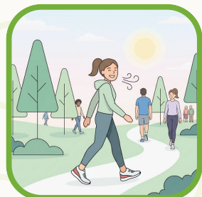
ウォーキング等 できることから