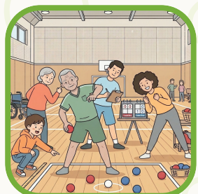
健康づくりの イベントに参加しよう