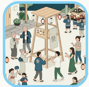
地域のイベントに 参加しよう