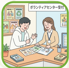
自分に合う ボランティア活動を探そう