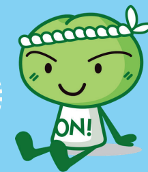
計画案内役「梅さん」

磯子区に暮らす一人ひとりが 今までよりほんの少し 自分のことも 周りの人も大切に…と考える そんな気持ちのスイッチをそっと押してみたら きっともっと素敵なまちになるよね