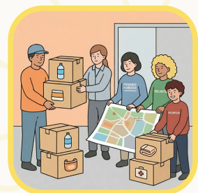
災害への備えを 地域で話してみよう