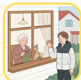
周りの人を 温かく見守ろう