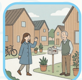
近所の人に あいさつしてみよう